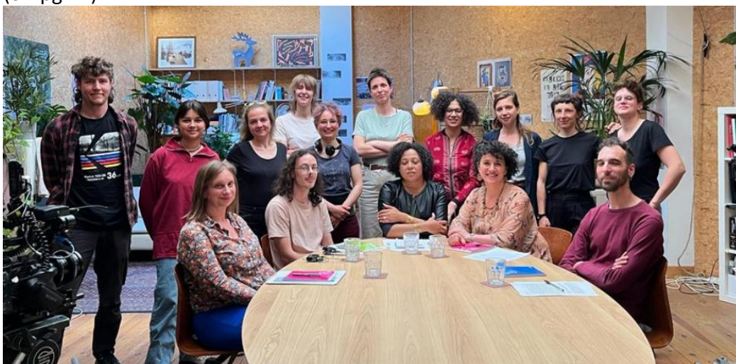
Dates: Septembre 2022 à juin 2023; Ateliers chant de sirènes: 15/01,29/01, 12/02, 16/02, 5/03